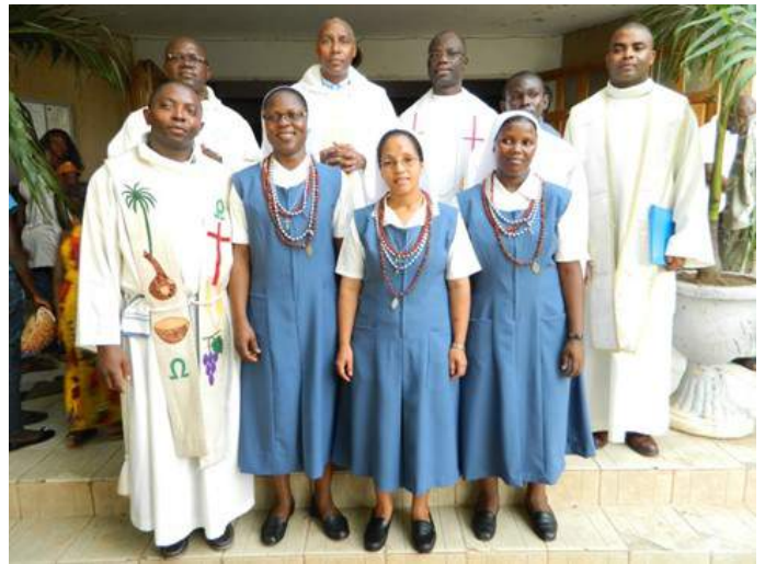
Nouvelles professes avec les prêtres