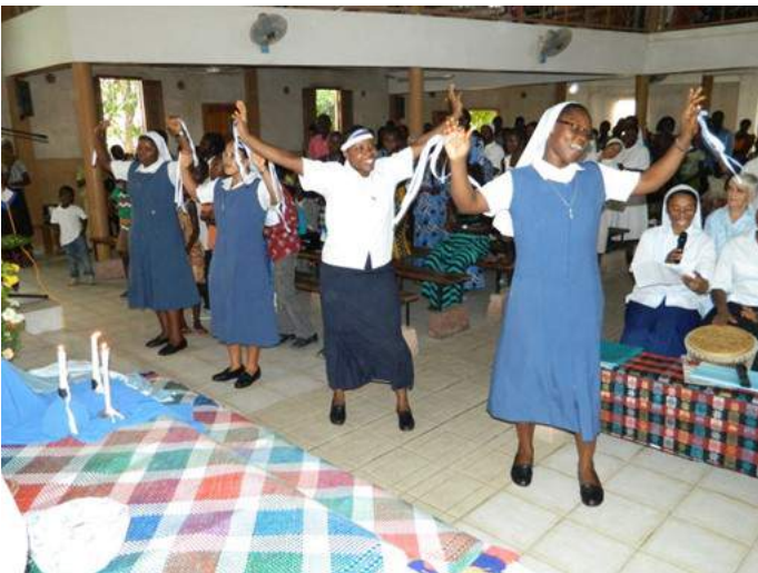
Danse d'action de grâces