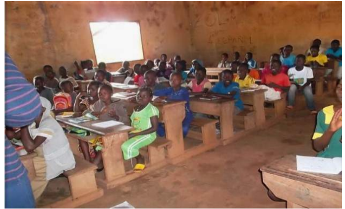
Children in the classrooms