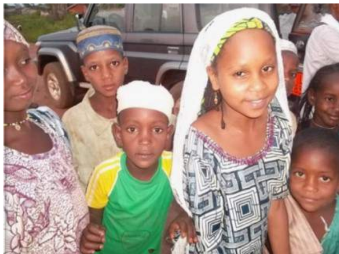
the children from the Bozize Site