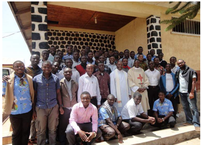
Family photo of some of the congregations at the closing of the formation year for postulancy

tions in isolation. The eyes of the candidates open to the realities of other congregations and challenges they face as they all strive to commit themselves to serving one and the same God.