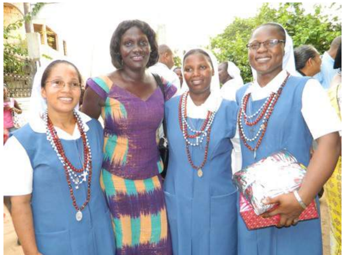
nouvelles professes avec une paroissienne