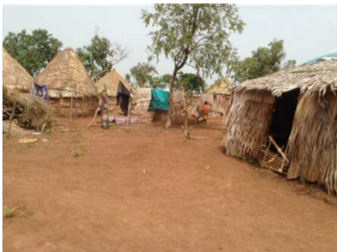
Bethany Refugees Site