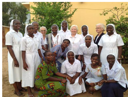
Photo de famille avec la nouvelle professe