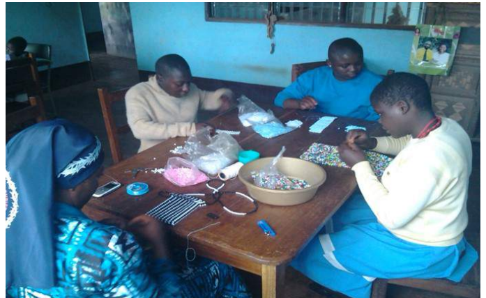
Conception of such little things

1) Our vision is to enlarge the vocational training sector with the introduction of a marking machine. Conception of earrings, bangles, neck chains with beads