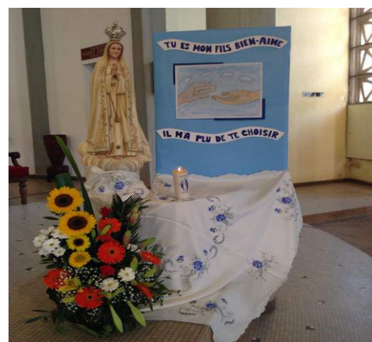
Symboliquement sur la banderole : « Tu es mon fils bien-aimé, il m'a plu de te choisir »