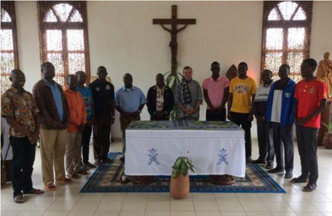
La communauté de Saint Pierre Chanel