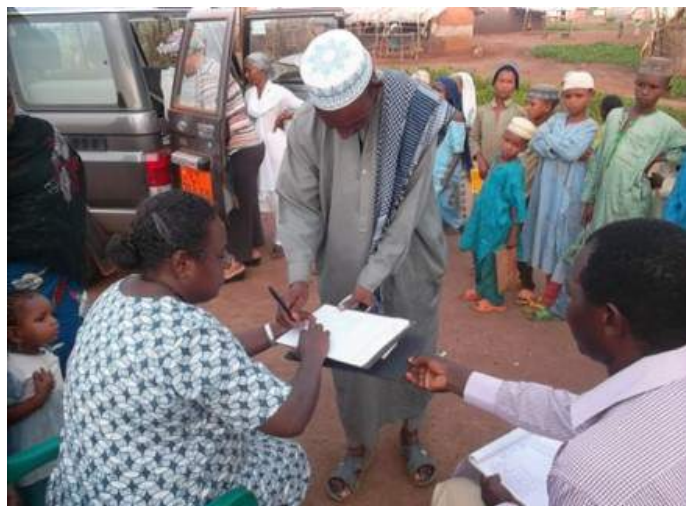
L-R: and Sr. Jeline getting a refugee from Bozize Site to sign for the materials received