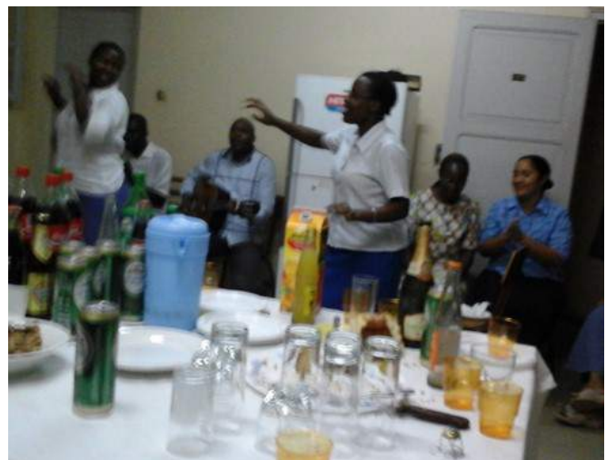
L'ambiance est vraiment festive avec la danse du Rwanda