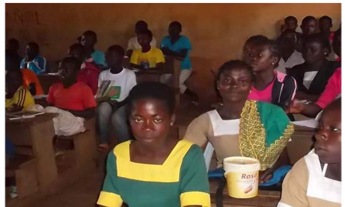
A good experience