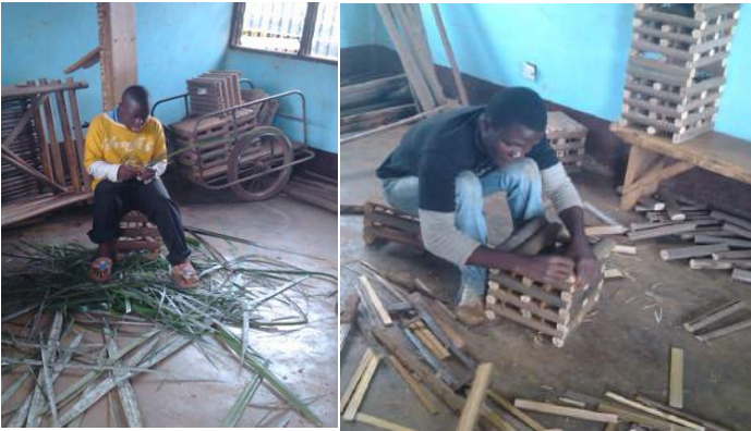
Conception of items with bamboo