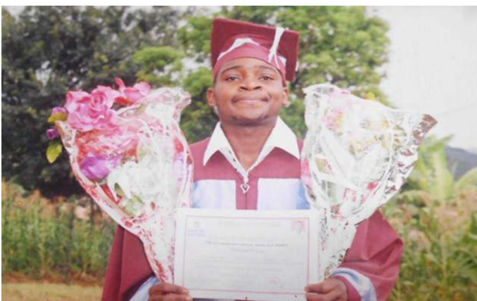
The one who graduated